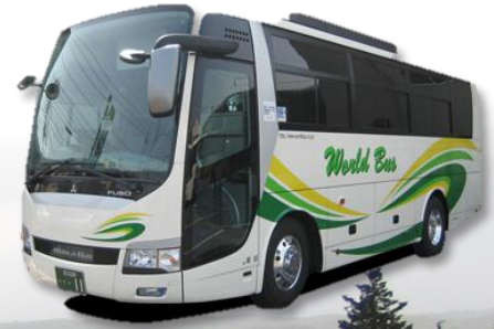
※バス会社は、予約状況、バス配車場所により異なります。